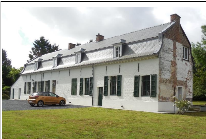
La Maison Fénelon (La voiture n'appartient pas à Fénelon)