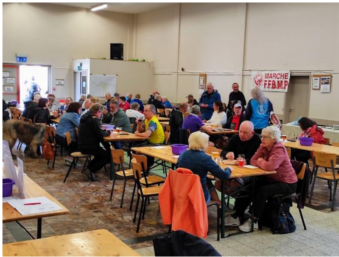
La salle du Foyer Rural