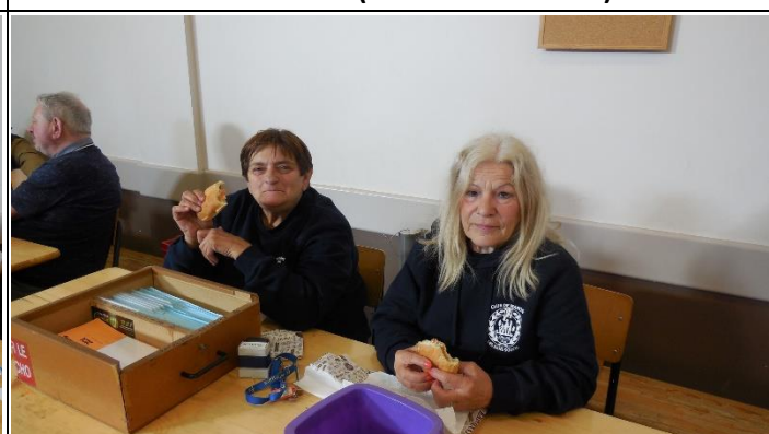
Les 2 Anna au stand ACHO