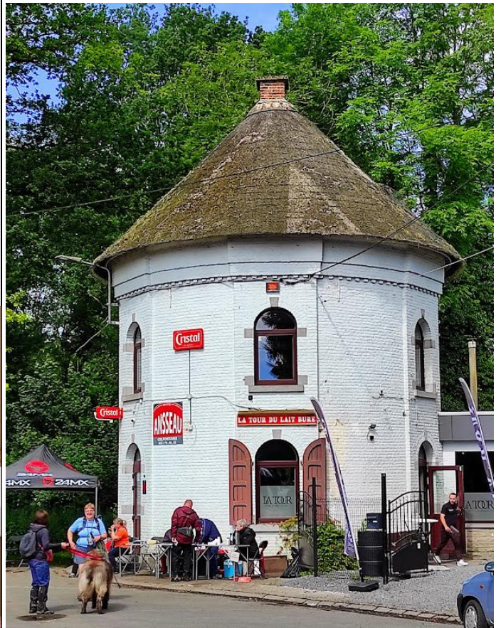
La Tour du Lait Buré