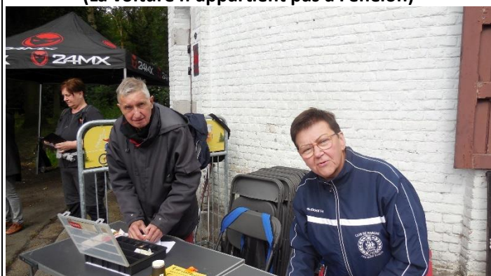
Contrôle de la Tour du Lait Buré